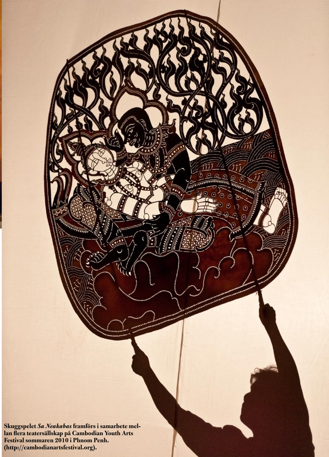
Skuggspelet Sa Neakabas framförs i samarbete mellan flera teatersällskap på Cambodian Youth Arts Festival sommaren 2010 i Phnom Penh. ( http://cambodianartsfestival.org ).