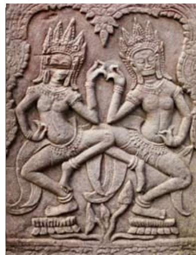
Below, bas relief of celestial dancers at Bayon Temple, Angkor